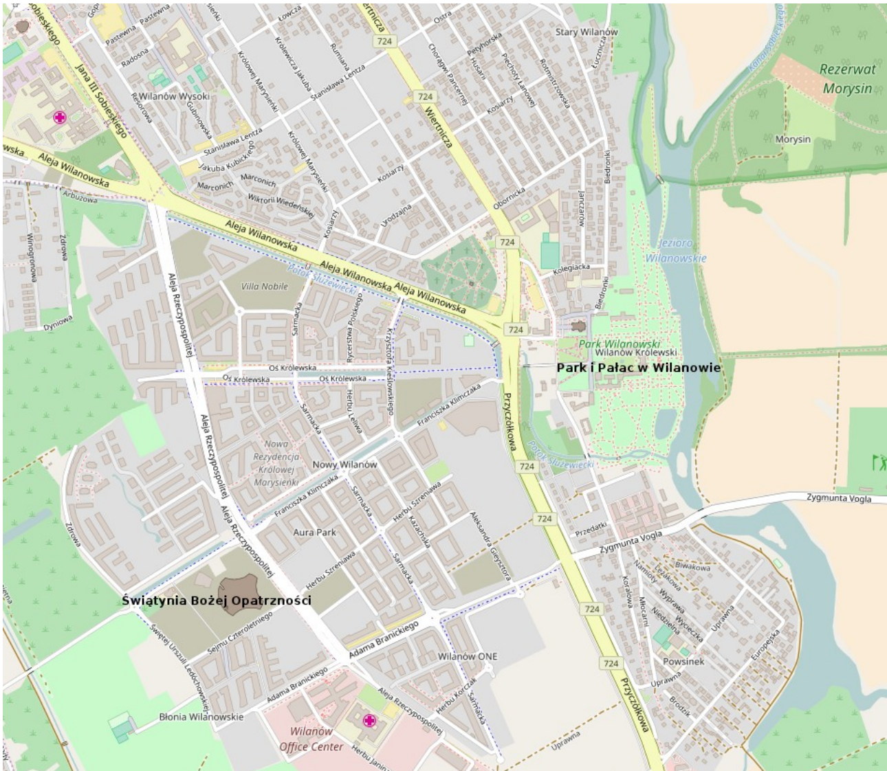
Ilustracja 1. Plan Wilanowa